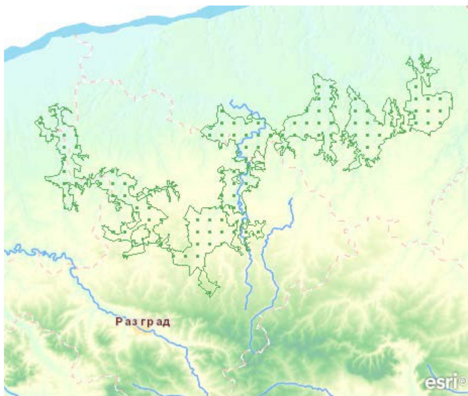
Фиг. 2. Защитена зона "Лудогорие" BG0000168

Основните заплахи са от сеч, лов, паша, изкуствено залесяване с неместни видове дървета